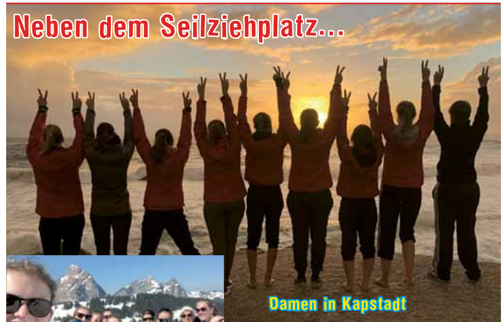
Damen in Kapstadt