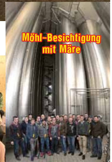
Möhl-Besichtigung mit Märe