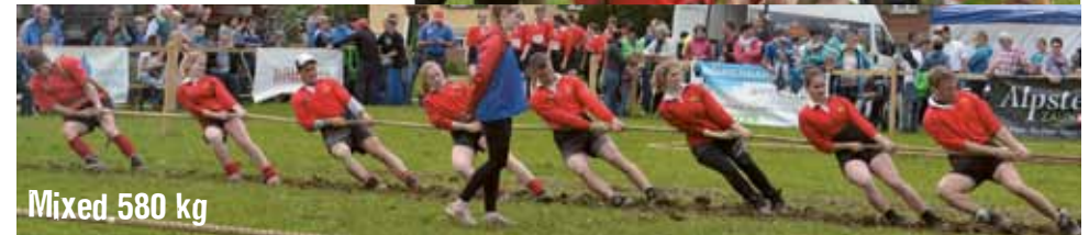
Mixed 580 kg

Das Mixed-Team musste sich nur von den Stansern geschlagen geben und landeten wie in Nottwil auf dem 2. Platz.