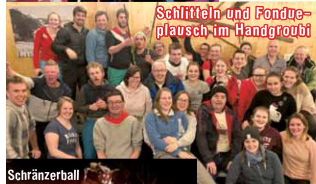
Schlitteln und Fondue- plausch im Handgroubi